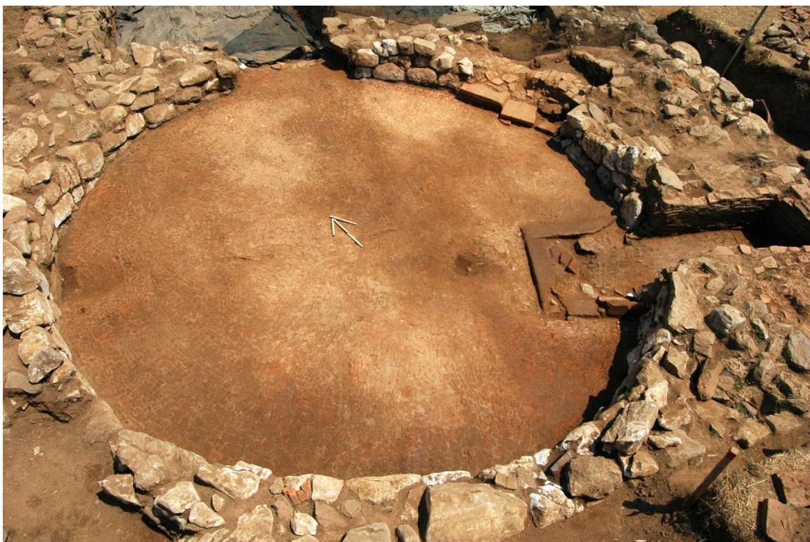
Εικ. 2. Το δωμάτιο 1 με το μωσαϊκό δάπεδο από κεραμίδια και την κόγχη στα δεξιά.

δραστηριότητες. Το δωμάτιο 1 είναι στρογγυλό και έχει μωσαϊκό δάπεδο από κεραμίδια (Εικ. 2). Από αυτό ξεκινούσε ένας ανοιχτός αγωγός υδάτων και συνέχιζε προς τα δυτικά διαμέσου του δωματίου 3. Στην ανατολική πλευρά του στρογγυλού δωματίου υπάρχει μια κόγχη, επίσης με μωσαϊκό δάπεδο από κεραμίδια. Η κόγχη εισέρχεται ελαφρώς μέσα στο στρογγυλό δωμάτιο, αλλά διαχωρίζεται ξεκάθαρα από αυτό με μια προεξέχουσα λωρίδα από τερακότα. Στο δωμάτιο 4 αποκαλύφθηκε ένας κλίβανος σε σχήμα σήραγγας με απότομο τελείωμα κοντά στην κόγχη, όπου και βρίσκονταν τα θεμέλια της καμινάδας.